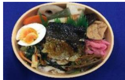
「金華さばの味噌焼弁当」