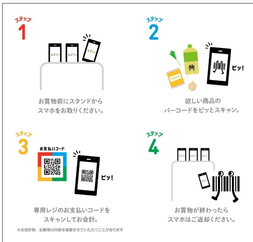
「レジゴー」ご利用の流れ

商品のスキャン終了後は、専用レジの2次元バーコードを読み取り、お買物データを連携しお支払い方法を選択するだけで簡単にお会計ができるため、“レジに並ばない”“レジ待ち時間なし”を可能にしています。お客さまご自身のペースで商品のスキャンからお支払いまで完結してお買物ができるほか、レジでの人との接触機会減少にもつながるため、感染症予防対策の一つとしても提案してまいります。