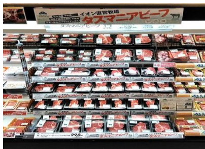
「タスマニアビーフ」

・畜産売場では、イオン直営牧場で生産している「タスマニアビーフ」を品揃えます。お肉がメインのすぐ食べられるお惣菜を揃えた「おつまみオードブル」コーナーでは、ローストビーフなどのおつまみをご用意します。