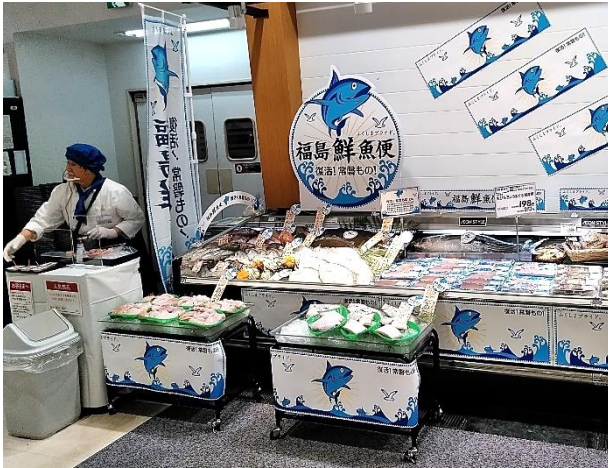
イオンスタイル品川シーサイド 福島鮮魚便コーナー