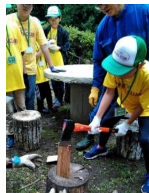
「火おこし体験」の様子

※2020年度・2021年度は新型コロナウイルス感染拡大の影響で集合での活動は自粛しております。