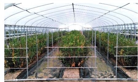
花のハウス栽培の様子

また、産地直送売場では、地場の農産物や加工品のほかに、新たに「地場のお花」を新規導入します。酒田市の生産者さまが丹精込めて育てたアルストロメリアやトルコキキョウ、カラーなどの花を品揃え、日々の暮らしに彩りを提案してまいります。