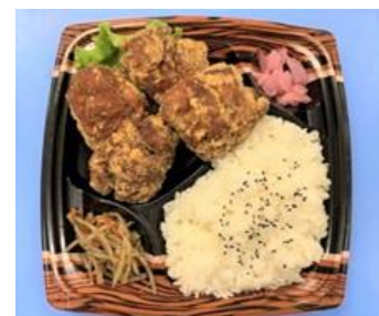
※画像はすべてイメージです。

また弁当コーナーでは、地元のお客さまに馴染みのある調味料「味どうらくの里」で味付けした唐揚げを使用した弁当「味わいでか唐揚げ！弁当（味どうらくの里使用）」などを品揃えます。