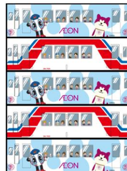
パッケージデザインイメージ

・ティッシュの原料のうち約75%に、岩手県を中心とした東北地方の広葉樹を使用しています。