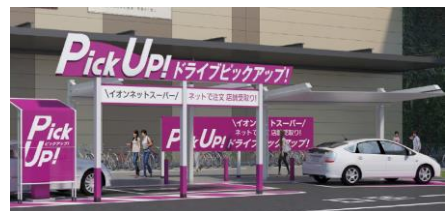
「ドライブピックアップ！」