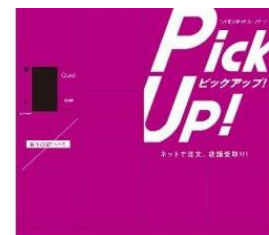
「ロッカーピックアップ！」